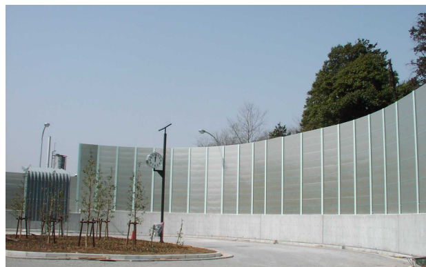
防音壁曲面部（内側）